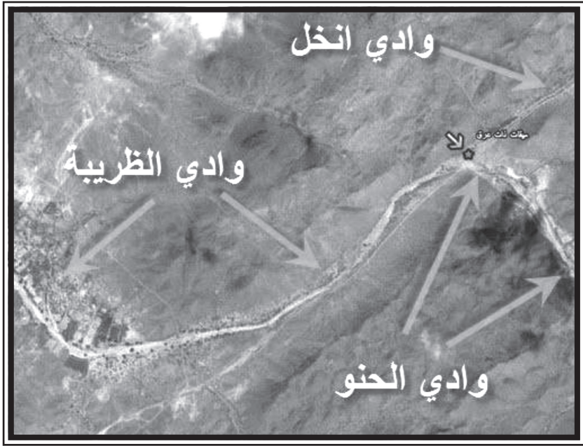
(خريطة توضح موقع الأودية المجاورة لذات عرق)

وبالله التوفيق، وصلى الله وسلم على نبينا محمد وآله وصحبه (١) .